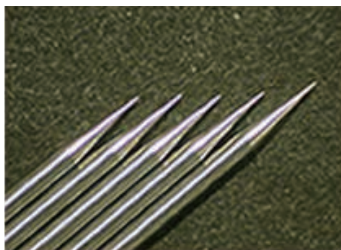
\phi 0.7 \cdot \theta 15^\circ \cdot 15\mu R

依客戶指定之材質、直徑 ( \phi D )、角度 ( \theta )、長度 ( L )、尖端 R 及外型 (Detail Z) 進行客製化生產。