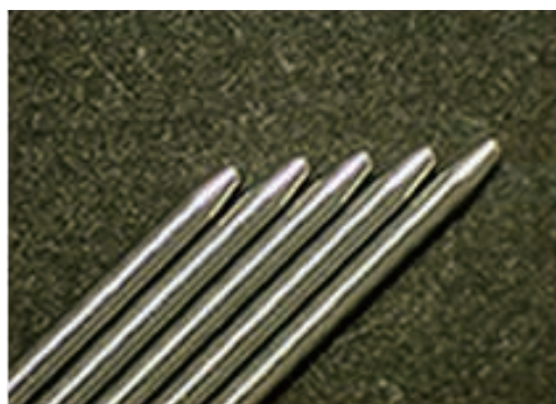
\phi 0.7 \cdot \theta 15^\circ \cdot 250\mu R