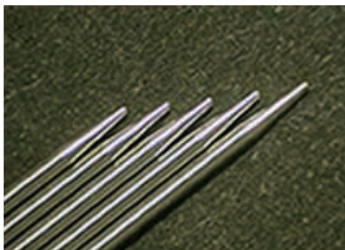
\phi 0.7 \cdot \theta 10^\circ \cdot 150\mu R