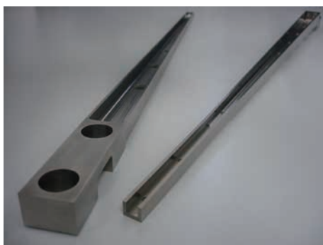
半導体製造装置用部品